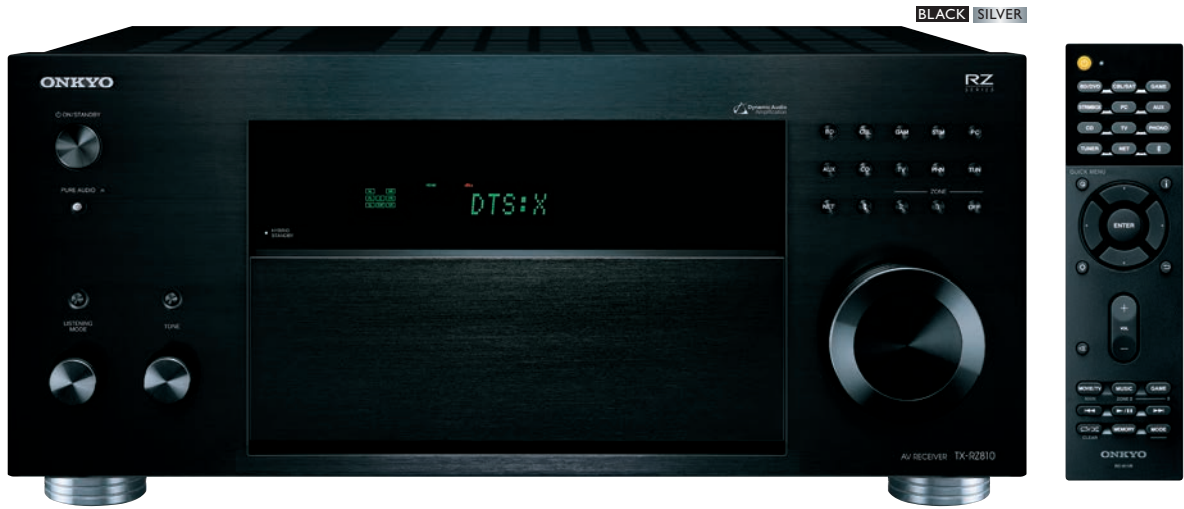
* Изображение ресивера после обновления ПО для декодирования DTS:X