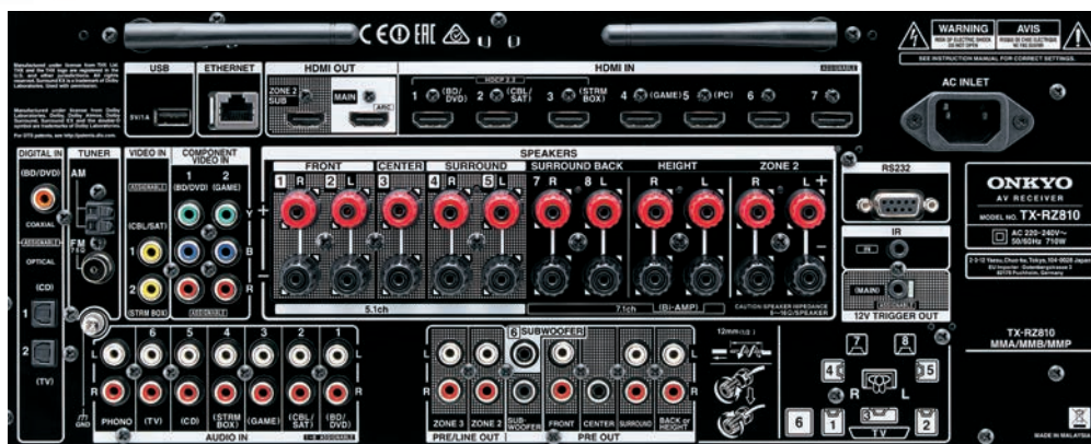
Текст на ресивере может отличаться в зависимости от региона.